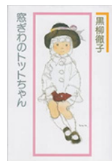
『窓際のトットちゃん』